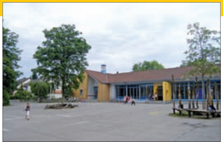
Grundschule Elkenbreder Weg