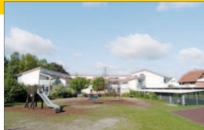
Grundschiule Auf der Insel