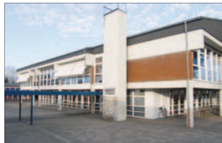
Grundschiule In der Senne