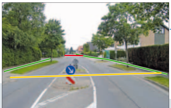
Keine Haftung bei Fehlern und Irrtümern.