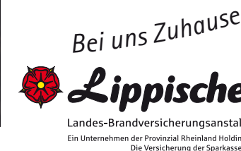
Keine Haftung bei Fehlern und Irrtümern.